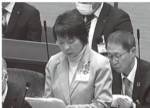
教育長による答弁

市長公約に、学校給食の品質向上ということが示され、物価高騰が厳しい中どのような手法や考え方で品質を向上させていくのかについても議論されました。