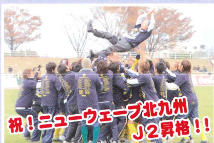
祝! ニューウェーブ北九州 J2昇格!!

昨年はニューウェーブ北九州が晴れてJ2昇格を決め、本市初のプロ球団誕生という記念すべき年となりました。